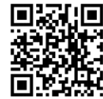
SC311m - EN